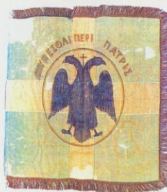
Σημαία του Μακεδονικού Αγώνα του οπλαρχηγού Ηλία Δεληγιαννίδη (Εθνικό Ιστορικό Μουσείο).