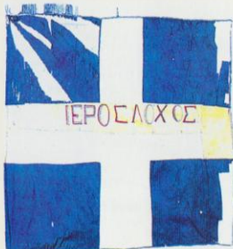
Σημαία κυανόλευκη του Κωνσταντίνου Μάνου από την Κρητική Επανάσταση του 1879. Φέρει κεντημένη την επγραφή ΙΕΡΟΣ ΛΟΧΟΣ. (Εθνικό Ιστορικό Μουσείο).