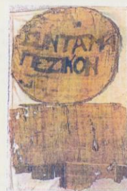
Σπάραγμα της σημαίας του Α' Συντάγματος Πεζικού του 1822 (Εθνικό Ιστορικό Μουσείο).